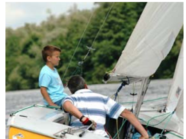
Régate au CVM – 91 Morsang / 06 60 08 1100